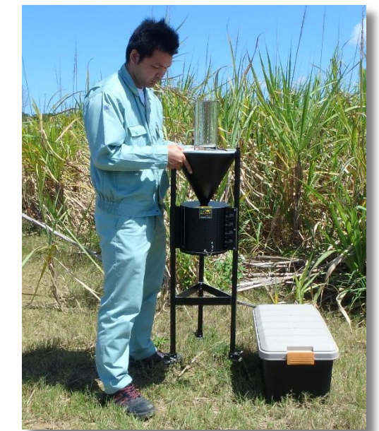
軽量なので一人でも楽に 持ち運びができます。