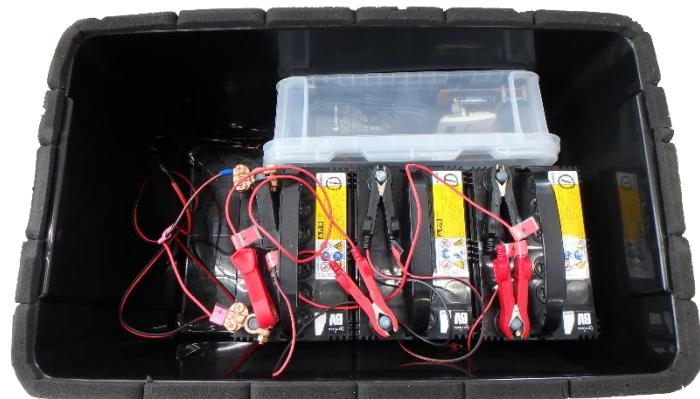
収納ボックス内部 (制御部・バッテリー3 個収納)