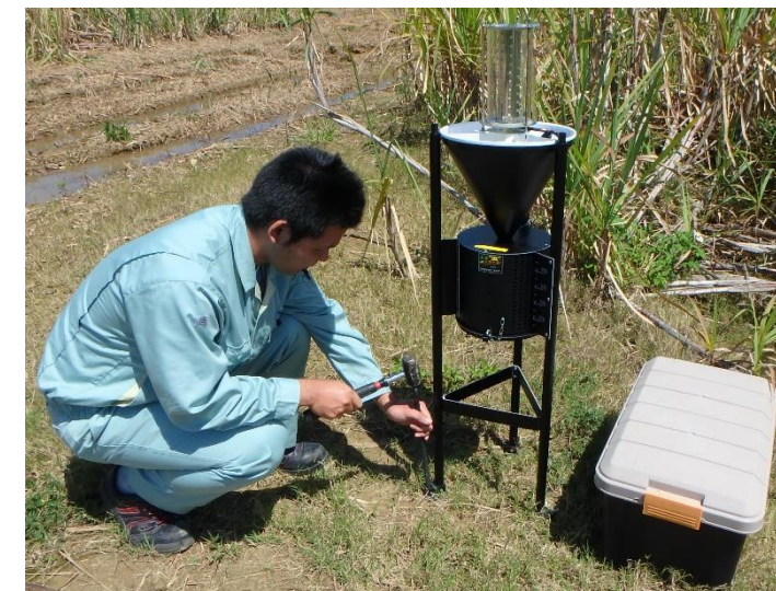
設置はハンマーで鉄杭を打ち込みます。